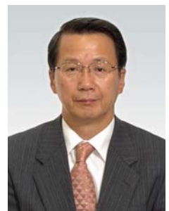
関西国際空港株式会社 代表取締役副社長

昨年度、PDCAを回す仕組みの構築の重要性を指摘しましたが、今年度の報告書では、各項目の活動報告の最初に「2008年度の総括」と「今後の取り組み」が記述され、これに続き具体的な活動内容が開示されています。このように関西国際空港のCSRマネジメントは着実に進化しています。今後は、ステークホルダーとの双方向のコミュニケーションを実現し、CSR活動の有効性の確認と社会のニーズの明確化に取り組まれることを期待します。