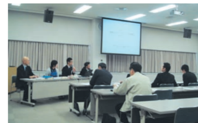
情報セキュリティポリシー・個人情報保護研修