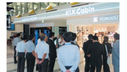
株主様の空港見学会

株主の皆様と直接対話する機会である株主総会では、当社についてのご理解を深めていただくための取り組みを実施しています。2009年6月の定時株主総会では、引き続き映像資料にグラフを多用するなど、よりわかりやすくしました。総会終了後は、関西国際空港の現状を理解していただく目的で、空港見学会を実施し、多数の株主様に参加いただきました。