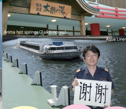
Arima hot springs (Taiko-no-yu)