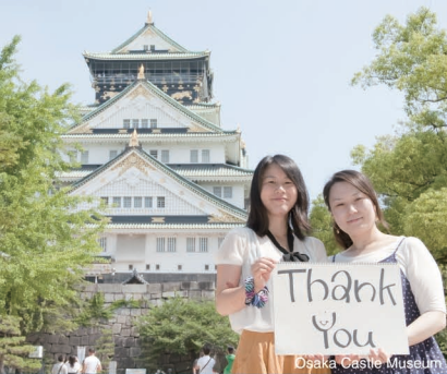
Osaka Castle Museum