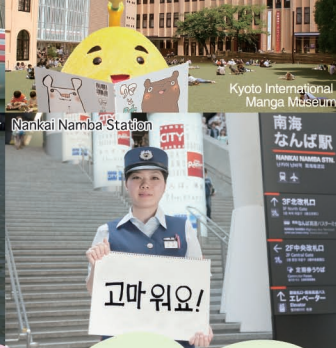
Aqua Liner Nankai Namba Station