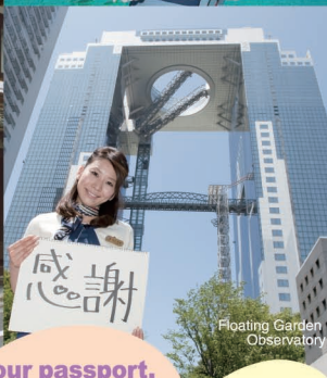
Floating Garden Observatory