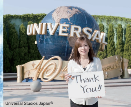
Universal Studios Japan®