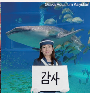
Osaka Aquarium Kaiyukan