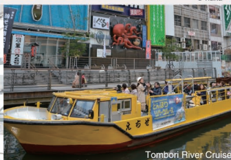
Tombori River Cruise