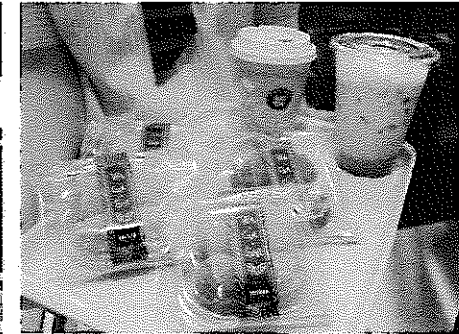
【当空港のドトールコーヒーショップ のみで販売するお菓子】