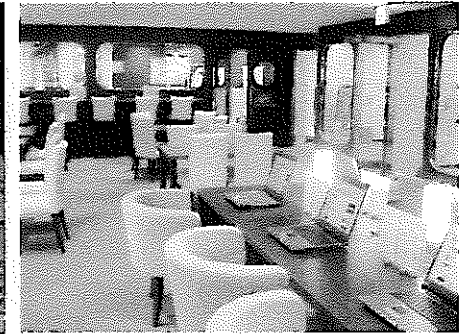
【ゆったりした居住空間を創出する室内】