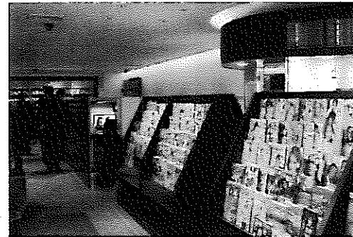
【多数の雑誌や新聞等を用意】