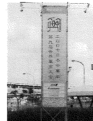
【関空に設置された世界華商大会PR広告塔】