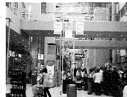
【空港内に設置しているPRパナー】