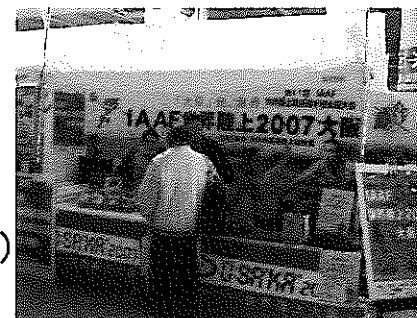
【関空旅博2007でのPRブース】